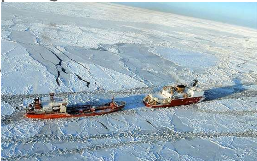
Ledoborec americké pobřežní hlídky Healy probíjí cestu zamrzlým Beringovým mořem ruskému tankeru Renda