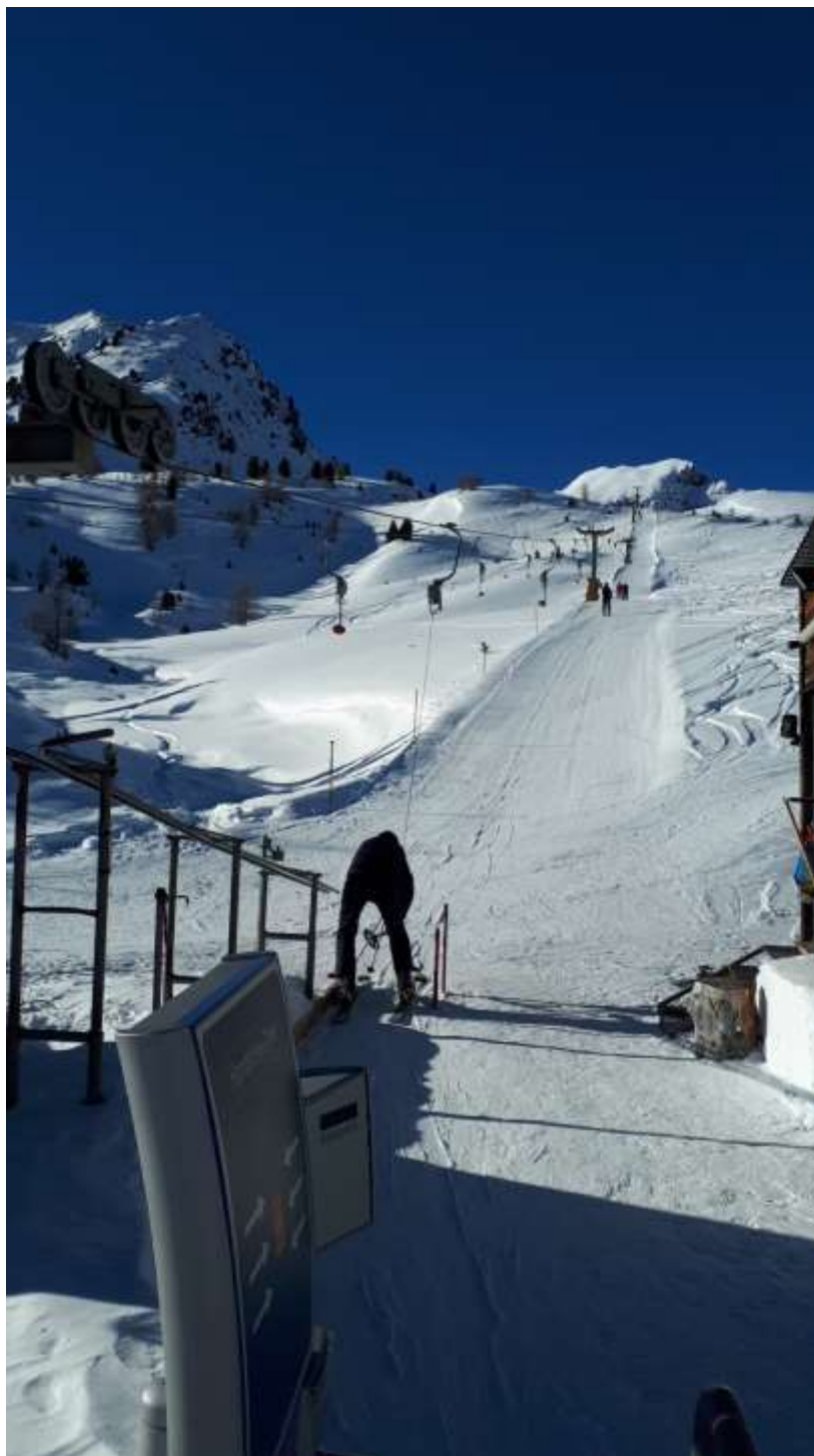
Také výtahy a lanovky byly zcela prázdné.