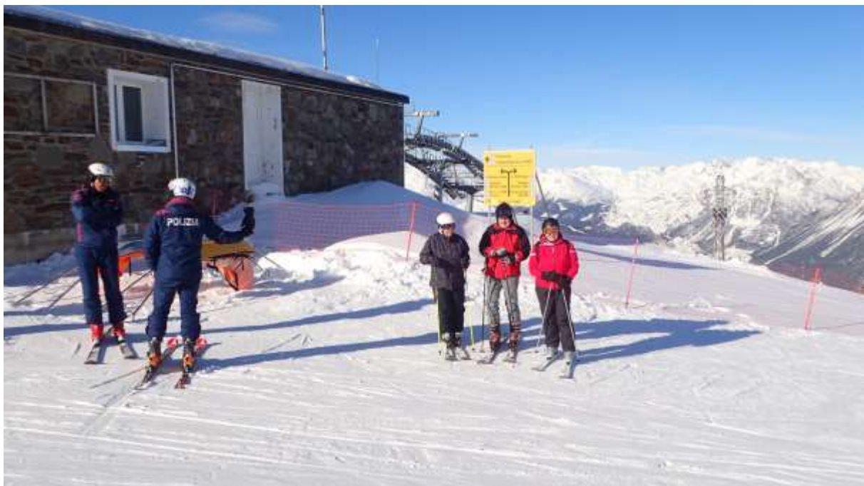
Tři čtvrtiny prvního družstva v ohnisku italské policie na sjezdovkách v Bormiu