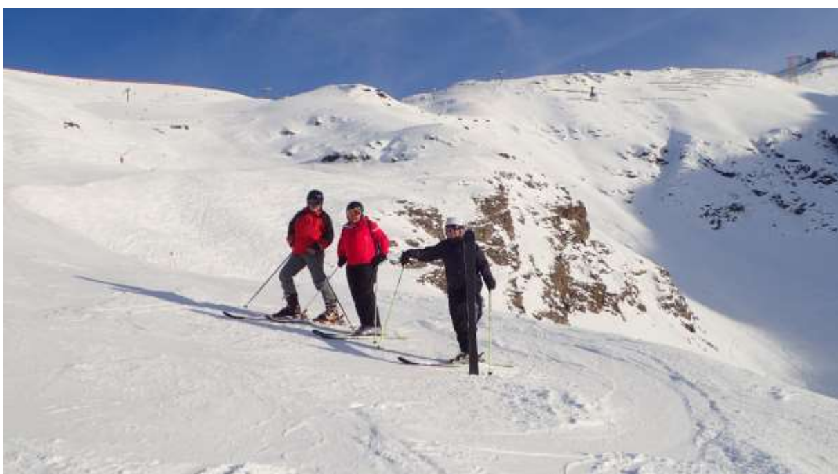
První družstvo sjíždí v Bormiu z třítisícovky