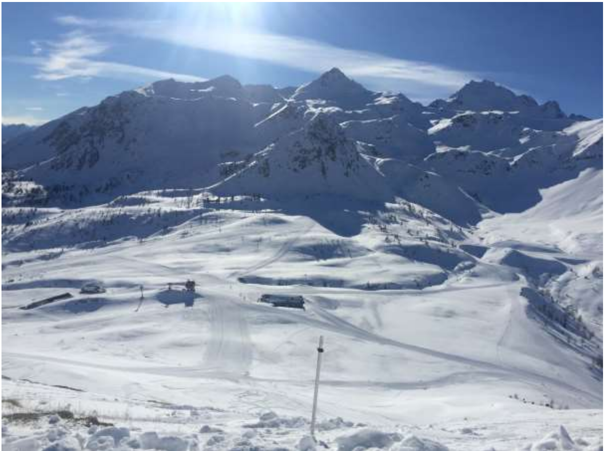
Pohled z nejvyššího místa v Al Forte