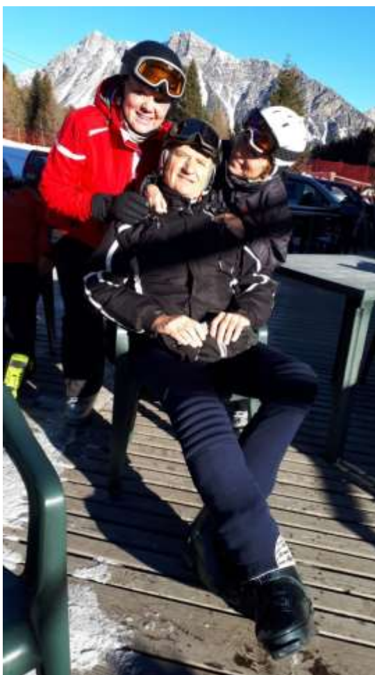
Pacík se ráno na terase pensionu Al Forte kochal blankytně modrým nebem.